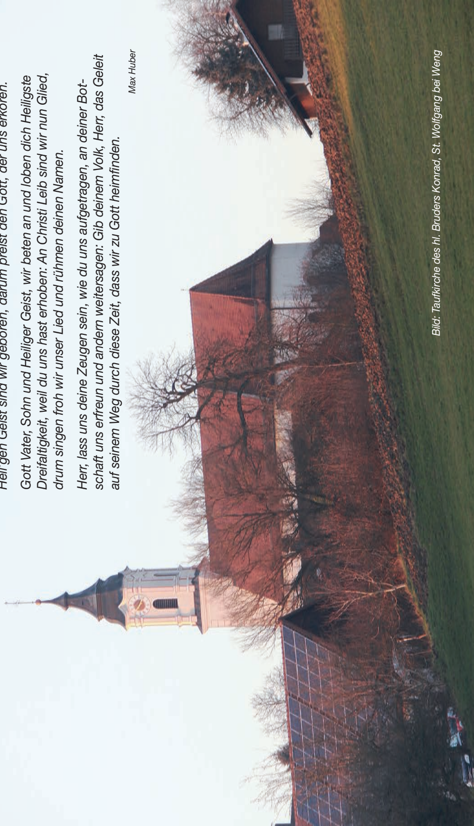
Bild: Taufkirche des hl. Bruders Konrad, St. Wolfgang bei Weng