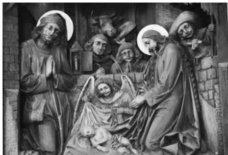
Krippendarstellung, Stille Nacht-Kapelle in Oberndorf.