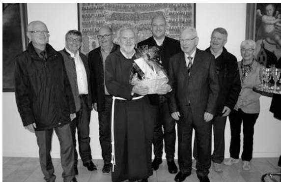
Die MC-Vorstandschafft gratuliert zum 40-jährigen Ordensjubiläum.